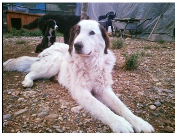
▲ En rastløs Dren i hundegården.