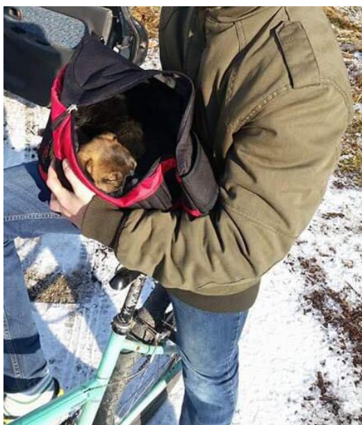
▲ En av valpene hviler seg i sekken til en ung gutt som deltok i redningsaksjonen.