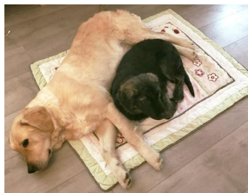
▲ Aldri mer gatehund – Goldie og valpen hennes koser seg sammen i sitt nye hjem i Norge.