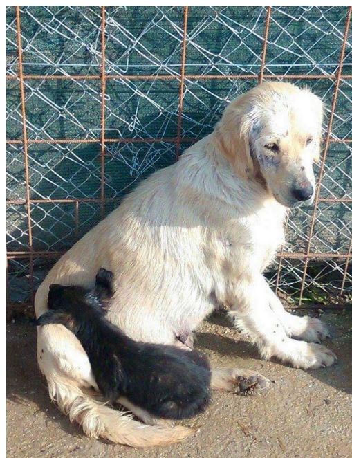
▲ Goldie og valpen hennes har endelig fått hjelp og medisinsk behandling. Her hviler de ut i karantenen.