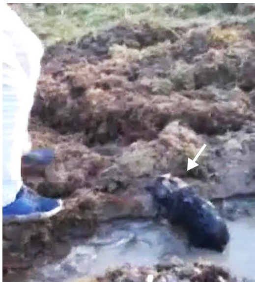
▲ Denne valpen blir hindret i å komme seg i sikkerhet etter at den brutalt ble kastet ut i den vannfylte grøfta.