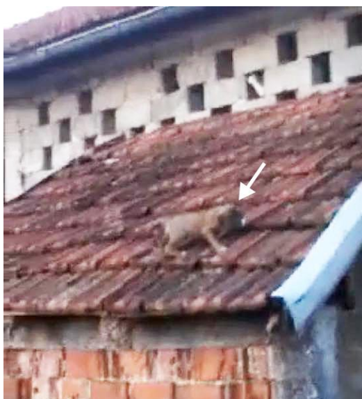
▲ Livredd og vaklende på ustøe ben roper denne valpen fortvilet om hjelp etter at den ble kastet opp på taket.

I romjula kom det en bekymringsmelding om en video som var lagt ut på nettet av valper som ble stygt mishandlet av unggutter. Takket være etterlysning med dusør, og rask reaksjon fra hundepasserer, ble valpene lokalisert og brakt inn til hundegården. Gjerningspersonene ble også identifisert. I Bosnia er det dessverre nytteløst å politianmelde overgrep mot dyr, men guttene fikk seg en alvorlig skjennepreken. Heldigvis kom valpene uskadede fra hendelsen.