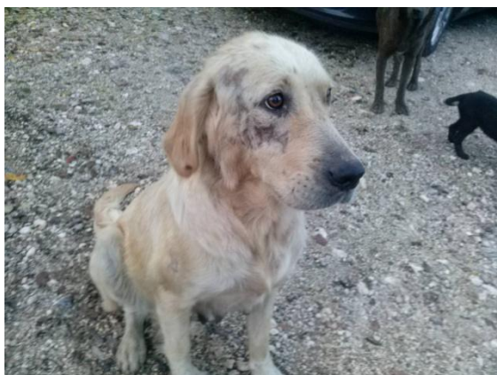
▲ Slik så Goldie ut ved ankomst til hundegården – totalt utslitt og med sår og arr over hele kroppen.

Goldie og hennes valp ble funnet i Sanski Most i oktober. Begge var helt utslitte og i dårlig form. Goldie hadde sår og arr over hele kroppen, og veterinæren mente at Goldie hadde blitt brukt som treningshund til hundekamper. Heldigvis overlevde begge hundene. Og etter noen uker i karantene med godt stell og hvile, så har de begge blitt flotte hunder! Idag lever mor og sønn sammen i Norge, og livet som gatehund i Bosnia har blitt et fjernt minne.