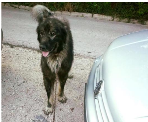
▲ Medo venter på transport til hundegården etter at han ble dumpet på gata.

Dren er av rasen Bosnisk Tornjak og ble levert inn til hundegården av sin eldre eier som ikke hadde råd til å ha ham lenger. Etterhvert ble det vanskelig å ha Dren i hundegården fordi han var aggressiv og kranglete mot andre hunder, så vi forsto at han trengte å komme til et fosterhjem der han kunne leve som brukshund. Vi var veldig heldige og fikk kontakt med den fantastiske fjellgården Ajanovic, som hadde lang erfaring med Tornjak'er og som sa seg villige til å ta imot Dren. Et par dager før avreise til fjellgården fikk vi også inn en annen stor hund av rasen Sarpalaninac, som vi ga navnet Medo. Medo ble dumpet på gata av eieren sin. Heldigvis sa familien på fjellgården ja til å ta imot Medo også. Medo og Dren har hatt det som plommen i egget og har fått fått lov til å drive med de er skapt for: Gjeting. Familien adopterte senere begge hundene.