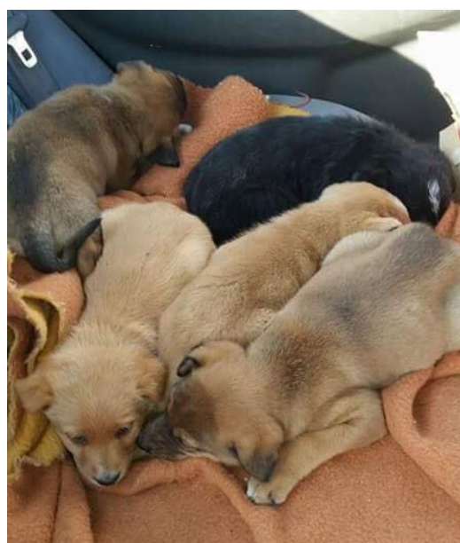
▲ På vei til et trygt og bedre liv.