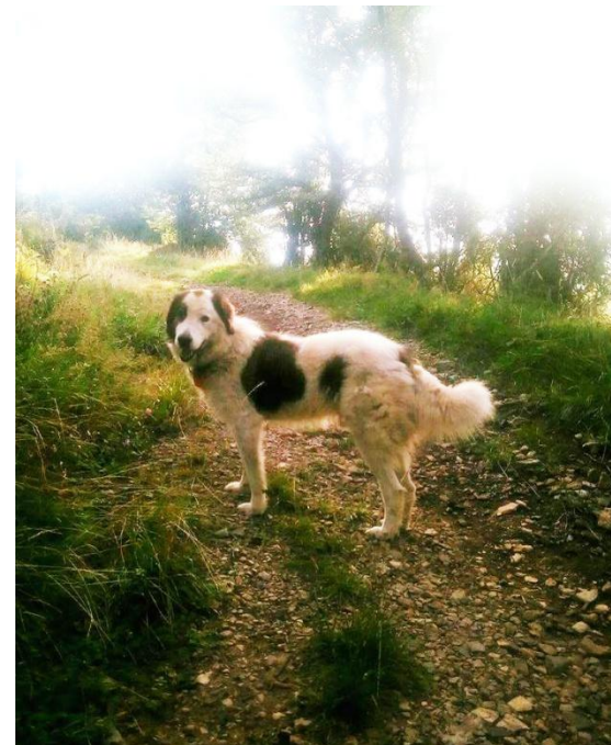
▲ Dren i nye og lykkelige omgivelser. Trivselen er endelig på topp igjen.